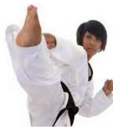
Kampsporten - barnfrågan

BARN: Vad heter sporten som du ser på bilderna ovan och här intill?