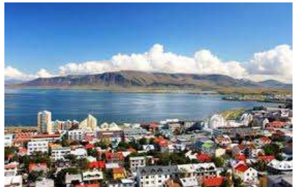
En bild till från Islands huvudstad