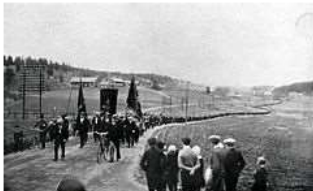
Demonstrationståget strax före ankomsten till Lunde.