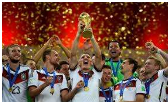
Tyskland vann förra mästerskapet