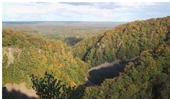
Utsikt från ? -hatten

BARN: Burkar som man lämnar till återvinning innehåller ofta en metall med Al som kemiskt tecken. Vad heter metallen?