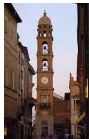
Klocktorn i staden

Mer om fajans: Staden, med knappt 60 000 invånare, heter alltså nåt liknande, nåt som sedan i folkmun blivit fajans.