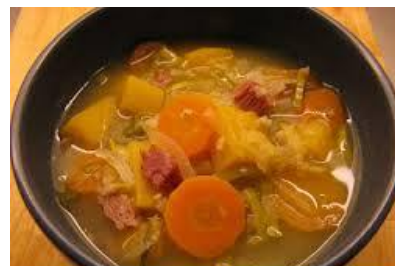
Soppa på fläsk, kålrot och korngryn