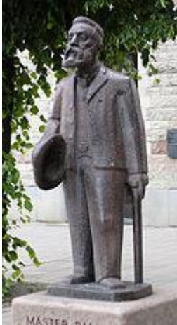
Hjalmar, en sann ...