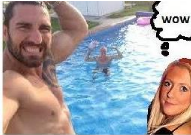
Han kan ... / försöker nog .... På henne

Skicka bara rätt svar på rebusen på baksidan